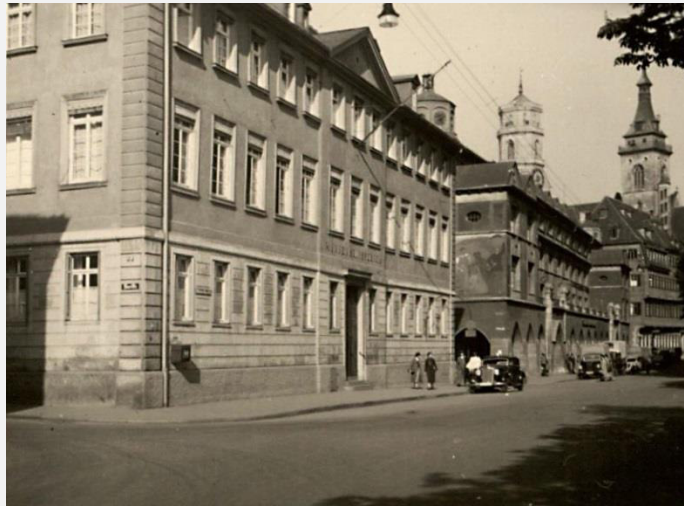
Hauptgebäude des Württembergischen Innenministeriums in der Dorotheenstraße (Hauptstaatsarchiv Stuttgart, Q 1/50 Bü 8).